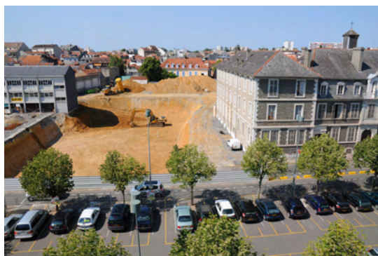
Juillet 2009 : décaissement du site