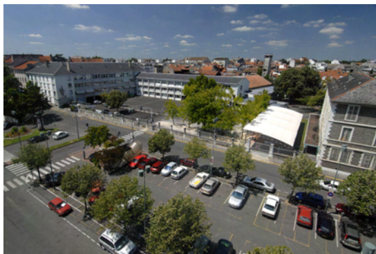
Site avant travaux juin 2009