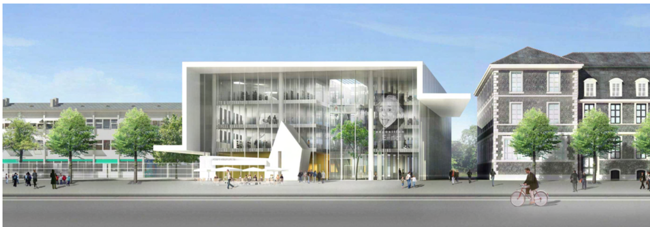
La MIDR achevée