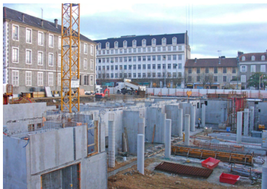
Décembre 2009 : chantier MIDR