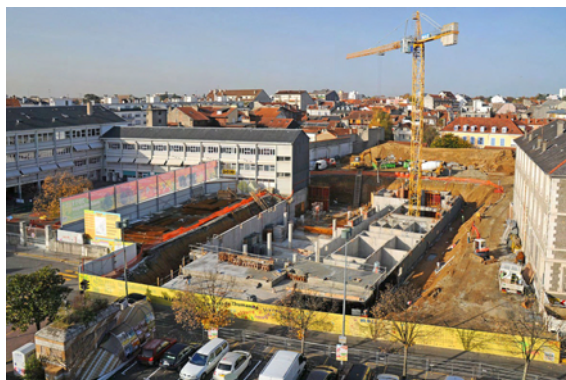
Décembre 2009 : chantier MIDR